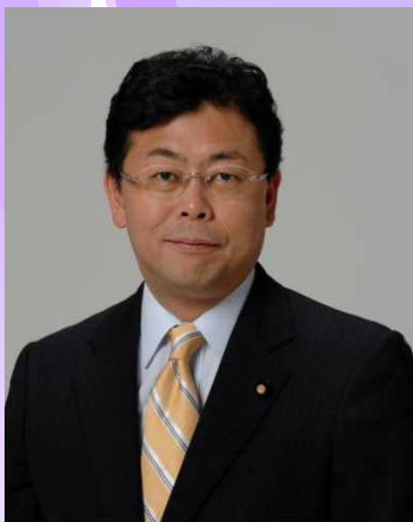
西田実仁 参議院議員

今後ともより一層のご支援をお願い申し上げますとともに、皆さまにとりまして素晴らしい一年となりますよう心よりお祈り申し上げます。