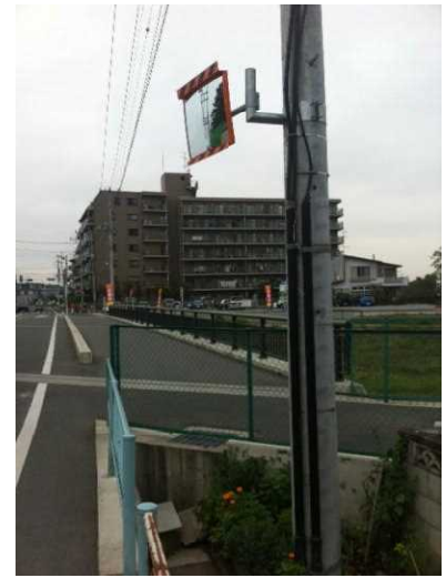
右 粕壁3丁目古隅田川十文橋近くにカーブミラーを設置しました。