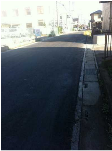
左 谷原3丁目道路の補修を行いました。