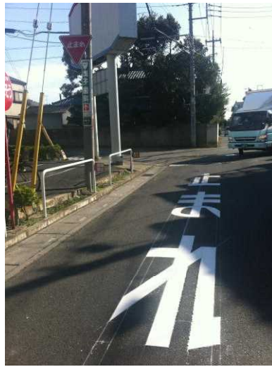
中 粕壁東コモディイイダ前の「止まれ」表示を塗り直しました。