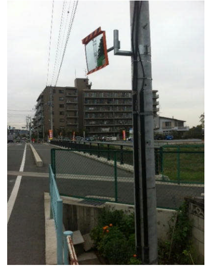
右 粕壁3丁目古隅田川十文橋近くにカーブミラーを設置しました。