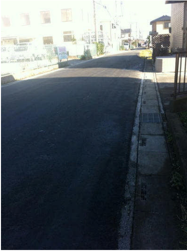
左 谷原3丁目道路の補修を行いました。