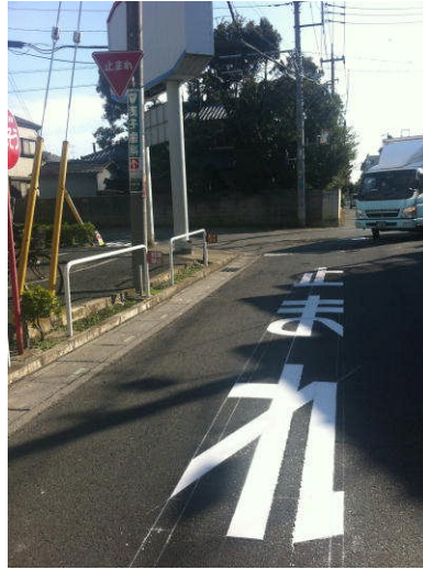
中 粕壁東コモディイイダ前の「止まれ」表示を塗り直しました。