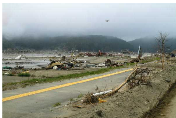
陸前高田市です。街が消えたままです。