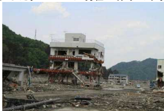
大槌町です。街が壊滅されたままです。