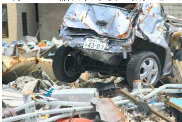
釜石市です。まだま手つかずです。