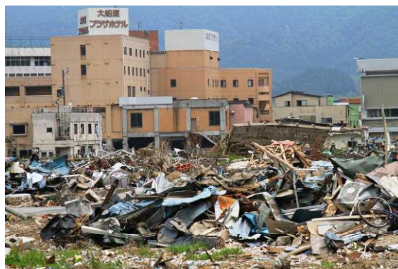
大船渡市です。街中まで瓦礫の山です。